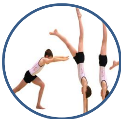
Activités Gymniques Acrobatiques