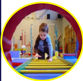
Activités d'Eveil Gymnique pour la Petite Enfance